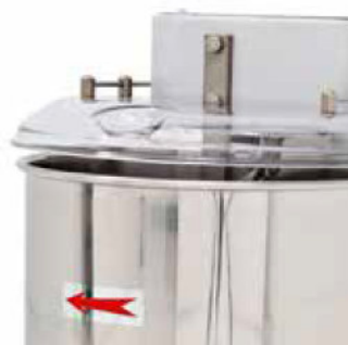
Conformes a UNE-EN 453