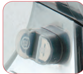
Interruptor marcha-paro con relé.