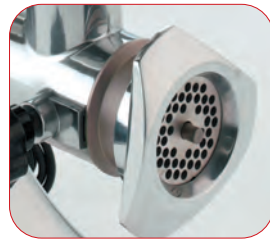
Detalle de la boca.