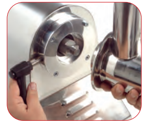
Modelo PI-32 con boca fácilmente desmontable para su limpieza.