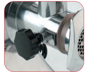
Completamente desmontable para una fácil limpieza.