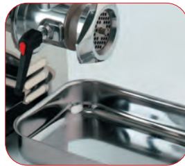
Bandeja de recogida en acero inox.