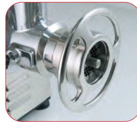
Detalle de la boca de la PI-22-U con sistema 1/2 Unger.