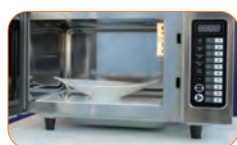
Base cerámica plana