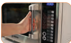
Todos los componentes de la cámara en acero inoxidable.