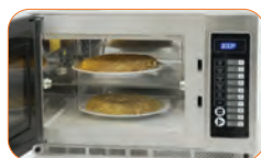
Gran capacidad de cocinado, gracias a sus dos niveles