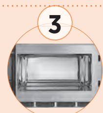
3 Cámara en acero inoxidable