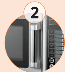
2 Asa ergonómica, que realiza el diseño del microondas