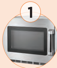
1 Cristal externo para poder visualizar el producto