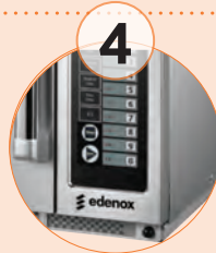
4 Filtro de aire desmontable. (modelo 1834)