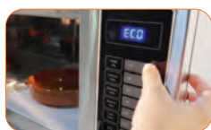
Panel de control "Touch" con led display, tres niveles de potencia.