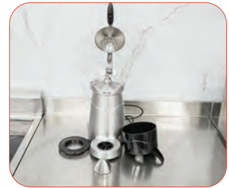
Cuerpo y palanca fabricados en aluminio pintado. Facil Limpieza.