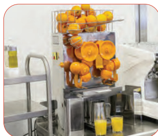
Fabricado en acero inoxidable, lo que garantiza durabilidad y facilita su limpieza.