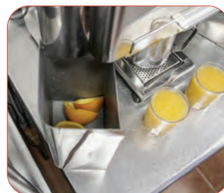
Doble depósito para recoger las cáscaras.