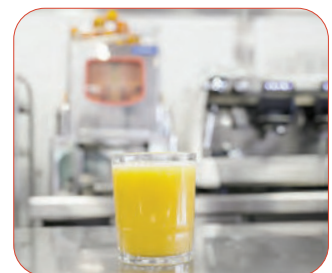
Ideal para bares y restaurantes con una demanda media-alta de zumos.