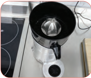
Equipado con motor universal para aplicaciones exigentes.