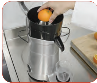
Exprimidor de cítricos eléctrico automático, con soporte para alojar el vaso.