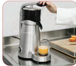
Activación automática al presionar la palanca.