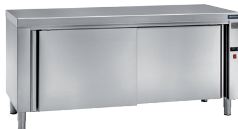
MEDIDAS MESA CALIENTE