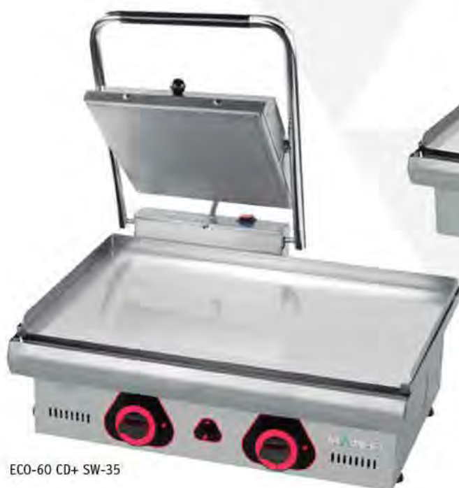
ECO-60 CD+ SW-35