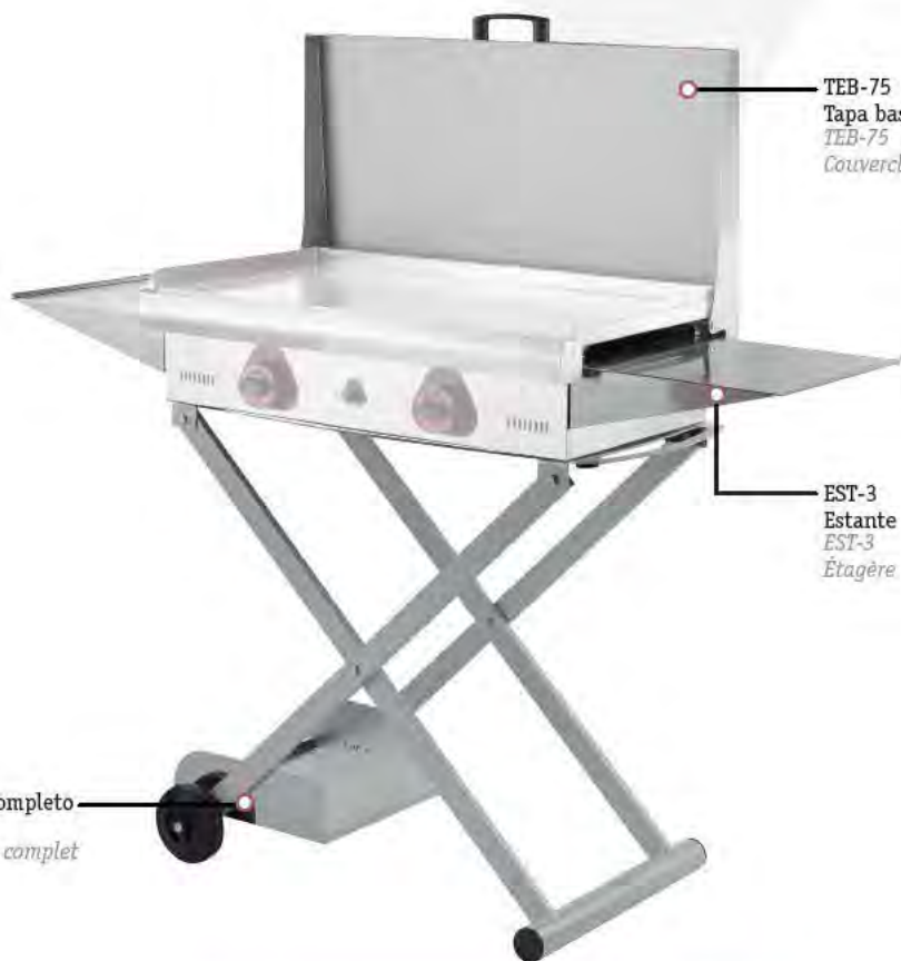
Carro completo X-75 Chariot complet X-75

Tous les équipements sont adaptés aux différentes séries de planchas économiques.