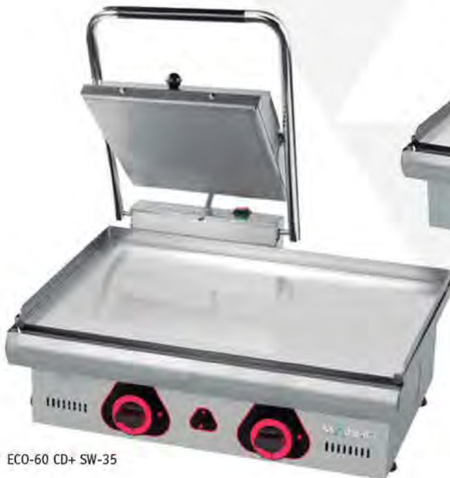
ECO-60 CD+ SW-35