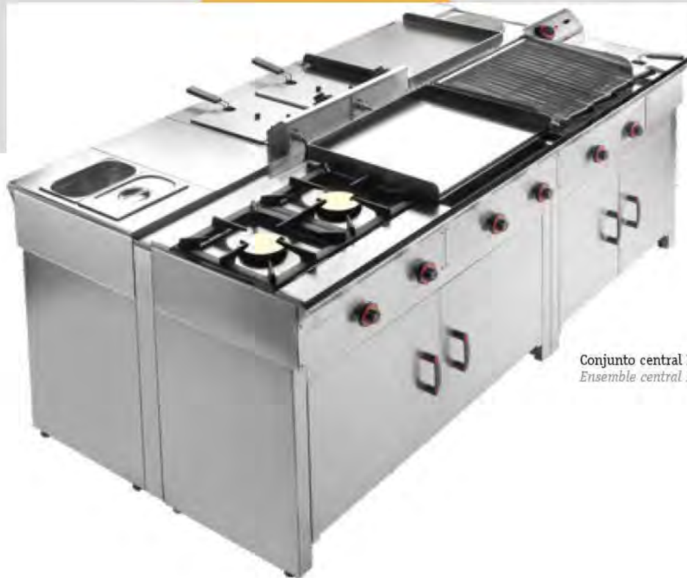
Conjunto central ECO-LINE Ensemble central ECO-LINE

COCINAS - PLANCHAS - BARBACOAS - FREIDORAS - BAÑO MARÍA - CREPERAS SOBRES DE TRABAJO - MESAS DE SOPORTE