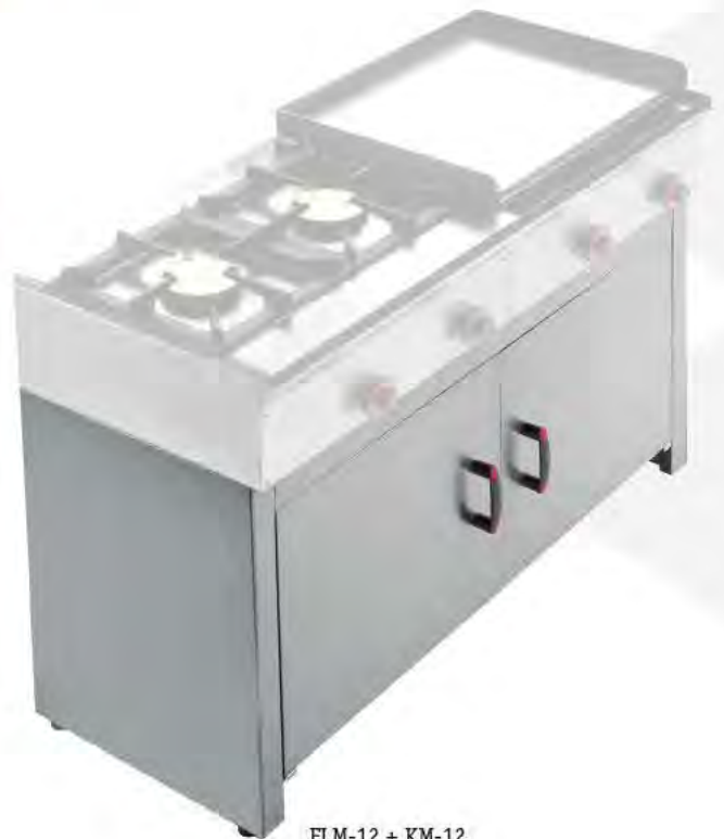
ELM-12 + KM-12