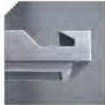
ASA ABATIDORES BF ANSE ABATTEURS BF