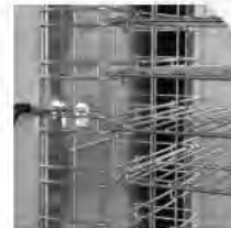
SONDA AL CORAZÓN SONDE AU CŒUR

Construidos en acero inoxidable Acabado pulido en la cámara, Scotch-Brite en el exterior Cámara con ángulos redondeados para facilitar la limpieza Aislamiento de 60mm, en poliuretano expandido libre de CFC y HCFC Control digital Sonda al corazón incluida Puerta reversible (solicitar en el momento del pedido) Micro interruptor paro ventilador Estructura porta bandejas desmontable para facilitar la limpieza Lámpara germicida (opcional) Condensación por aire Sistema "defrost" automático Conservación automática de fin de ciclo Preinstalación para USB y HACCP (para los modelos "BF")