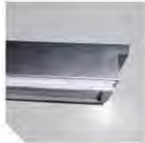
ASA ABATIDORES BE ANSE ABATTEURS BE