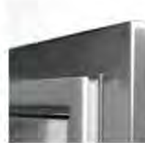
CIERRE MAGNÉTICO FERMETURE MAGNÉTIQUE