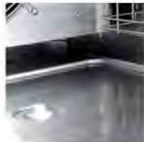
DESAGÜE INTERNO ÉCOULEMENT INTERNE