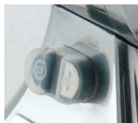
Interruptor marcha-paro con relé.