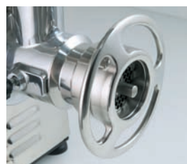
Detalle de la boca de la PI-22-U con sistema 1/2 Unger.