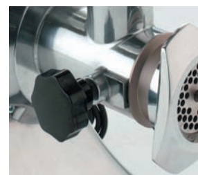
Completamente desmontable para una fácil limpieza.