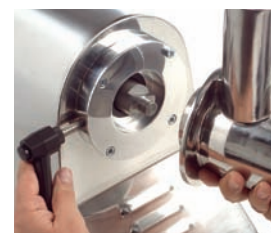
Modelo PI-32 con boca fácilmente desmontable para su limpieza.