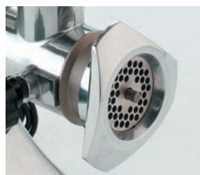
Detalle de la boca.