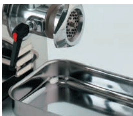
Bandeja de recogida en acero inox.