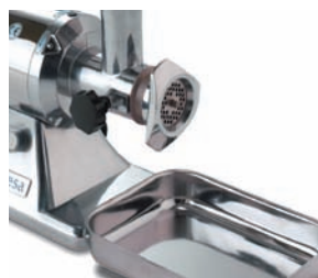
Con bandeja de recogida en acero inoxidable incorporada.