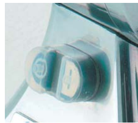
Interruptor marcha-paro con relé.