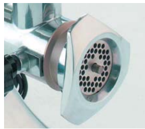
Detalle de la boca.