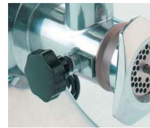
Completamente desmontable para una fácil limpieza.