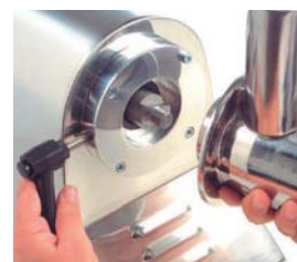
Modelo PI-32 con boca fácilmente desmontable para su limpieza.