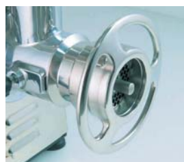
Detalle de la boca de la PI-22-U con sistema 1/2 Unger.