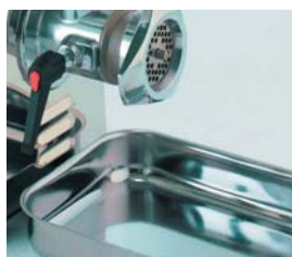
Bandeja de recogida en acero inox.