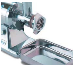
Con bandeja de recogida en acero inoxidable incorporada.