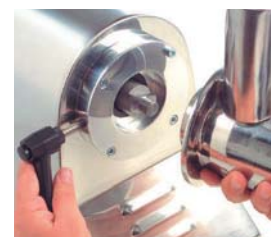
Modelo PI-32 con boca fácilmente desmontable para su limpieza.