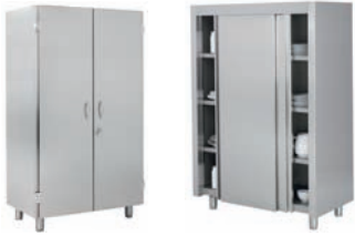
Armarios de pie Estructura robusta con una gran capacidad de almacenamiento.

La Línea Estándar de muebles neutros de edenox le ofrece soluciones integrales a los proyectos de las cocinas industriales, con una amplia gama de muebles en acero inoxidable (fregaderos, mesas, armarios, lavamanos, grifería, etc.) pensados y creados para aprovechar al máximo los espacios, manteniendo una línea homogénea en toda la gama de artículos, muebles funcionales y duraderos.