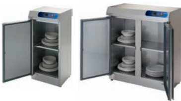
Cuentan con doble pared de aislamiento de poliuretano inyectado ecológico, libre de CFC. Burlete de alta calidad en todo el perímetro de la puerta que evita las pérdidas de calor.

ARMARIOS DE LIMPIEZA: Diseñados para el almacenaje de artículos de limpieza en un lugar higiénico y seguro.