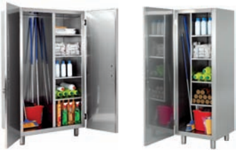
Armario de limpieza Facilita la organización de los productos de limpieza, respetando las normativas sanitarias.

ARMARIOS DE PIE: Cuentan con una gran capacidad de almacenamiento. Están diseñados para mejorar la higiene y cumplir con las normativas de sanidad.