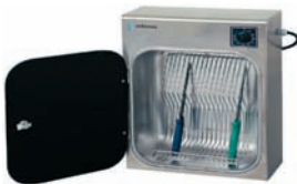
Descontamina utilizando una lámpara germicida de rayos UV.

ARMARIOS CALENTADORES DE PLATOS: Diseñados para el calentamiento y mantenimiento de los platos, durante los servicios de comidas.