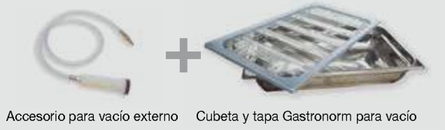
Accesorio para vacío externo