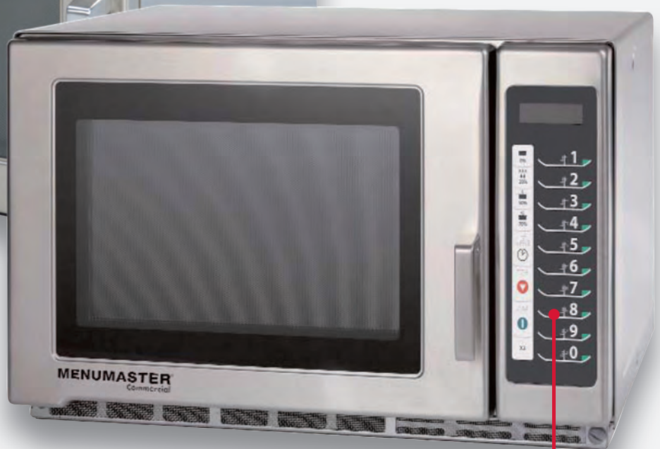
Mod. RFS 518 TS

Programación de hasta 100 menús con 5 niveles de potencia y tiempos de hasta 60 min.